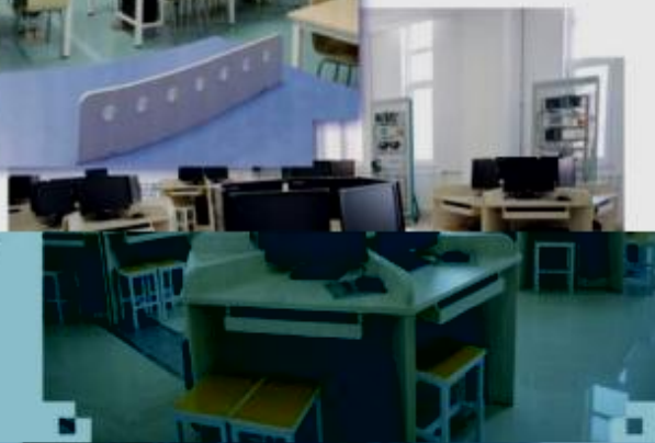
一体化课程教学设计综合实训室